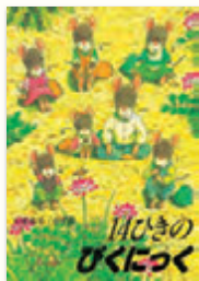
「14匹のびくにく」 作・絵：いむら かずお / 童心社

公園を訪れた人に、生きものの魅力や不思議を伝えるパークレンジャー。そんな彼らに影響を与え、今も記憶の中に生き続ける思い出の絵本を紹介します。