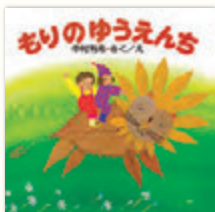
「もりのゆうえんち」 作・絵：中村有希 / PHP研究所