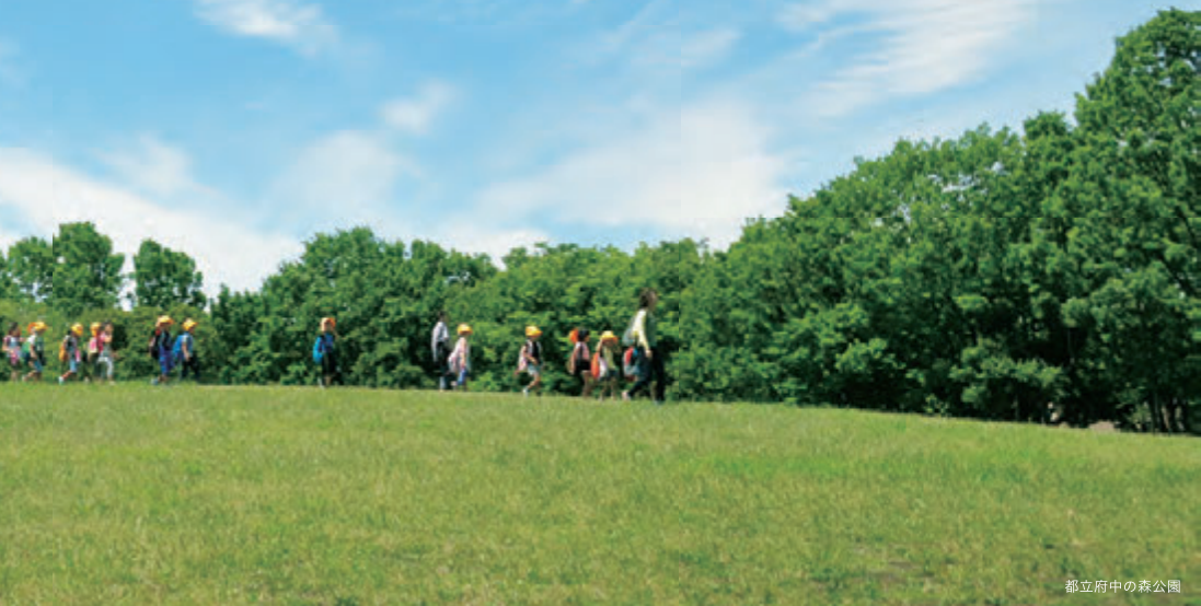
都立府中の森公園

ダメと言われるとつい反対のことをしてしまう11びきのねこたちは、最後に痛い目にあいながらも学んでいきます。いつもの公園も、みんなといればちょっとびり大胆なこともしたくなる冒険の場になるかもしれません。