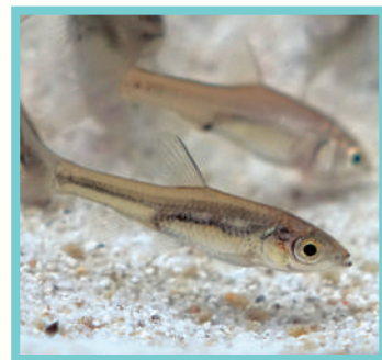
モツゴはクチボソの 名でも親しまれてき た日本の在来種。

むかしから農地のため池では、だんだん溜まっていく落ち葉などを掃除をするため、地域が一体となって、定期的に水を抜いて手入れしていました。池の水をぜんぶ抜き、生きものを捕獲し、底泥の天日干しをして、水質を浄化する。これを「かいぼり」と言います。