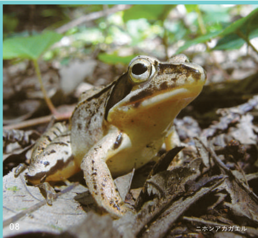
ニホンアカガエル