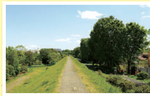
③ 狭山・境緑道 馬の背 多摩湖から境浄水場までの水道管の上に敷いた緑道。フデリンドウなど貴重な野草が残る。