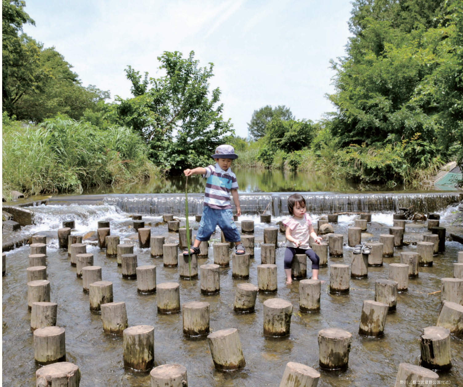
野川（都立武蔵野公園付近）