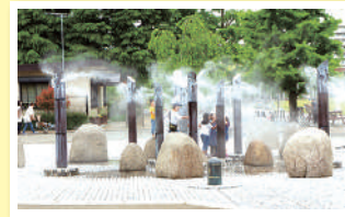
④ 武蔵国分寺公園 霧の噴水 真夏の暑さにミストのシャワーが気持ちいいと人気。毎年5月～9月頃稼働する。