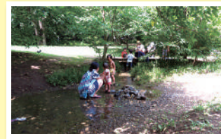
⑤ 武蔵野公園 じゃぶじゃぶ池 5月～9月の土日には小さな子どもたちの水遊び場となる。