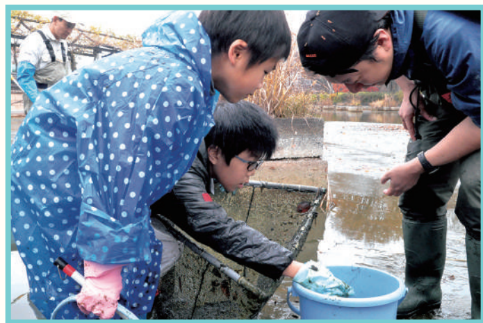
かいぼりで見つけた池の生きものを 子どもたちは真剣なまなざしで観察。