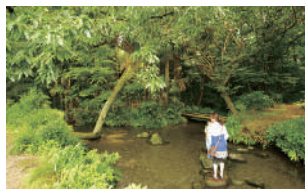
② 南沢湧水群 1日約1万トンの地下水が湧き、落合川と合流。野趣あふれる自然の水辺が散策できる。