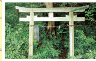
⑥ 野川公園 わき水広場 国分寺崖線から流れ出る天然のわき水にふれあえる、野川とともに人気の水遊び場。