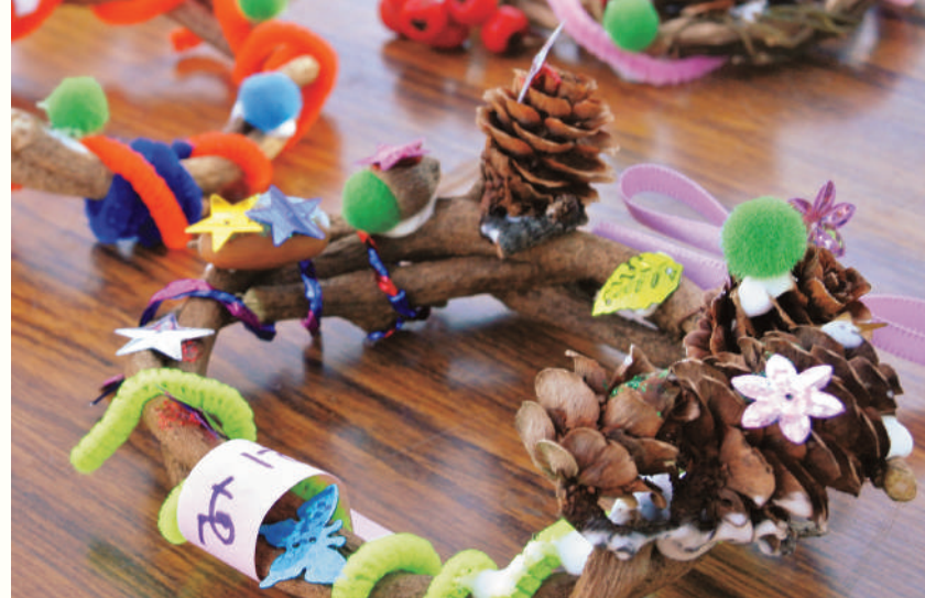
都立武蔵国分寺公園で行われるイベント「あそブンの森」、2016年は12月10日に開催予定。公園で見つけた葉っぱや木の実を使った、楽しいプログラムが満載（雨天の場合は翌日）。