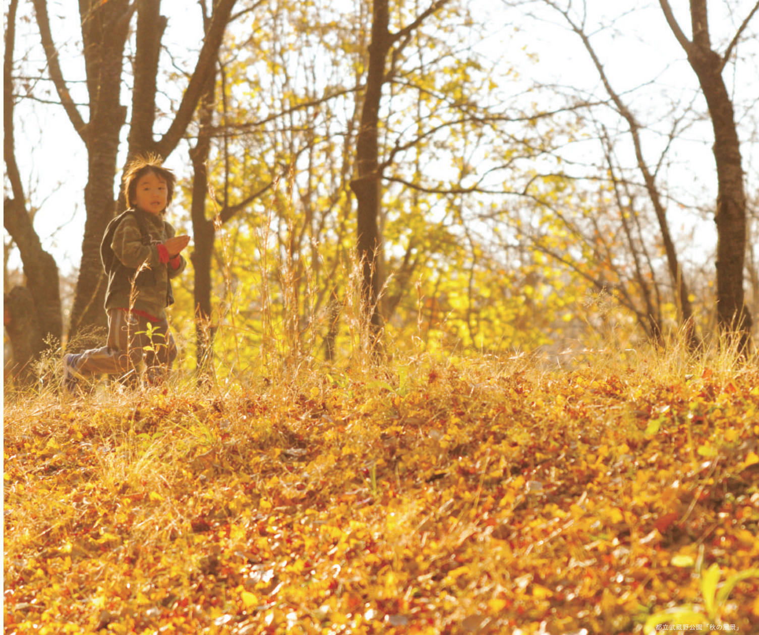
都立武蔵野公園「秋の風景」