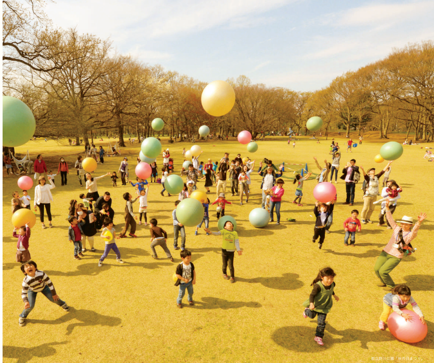
都立野川公園「秋の日まつり」