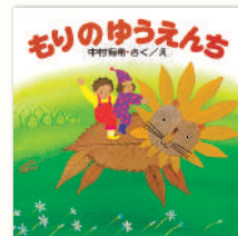
「もりのゆうえんち」 作・絵：中村有希 / PHP研究所

公園を訪れた人に、生きものの魅力や不思議を伝えるパークレンジャー。そんな彼らに影響を与え、今も記憶の中に生き続ける思い出の絵本を紹介します。