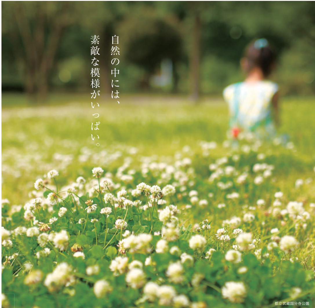
都立武蔵国分寺公園