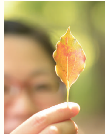
この「にじ色のきつぶ」は、クスノキの葉。クスノキは、初夏から夏にかけて落葉します。葉を折ると、爽やかな香りも楽しめます。

幼少の頃楽しみだった母親からのお土産は、道端で拾った「タマシのはね」や「セミの抜け殻」。以来、自然に興味を持ち、パークレンジャーの世界に飛び込む。いまだに道端に落ちているステキなモノ探しが好き。