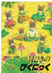
「14ひきのびくにつく」 作・絵：いわむら かずお / 童心社