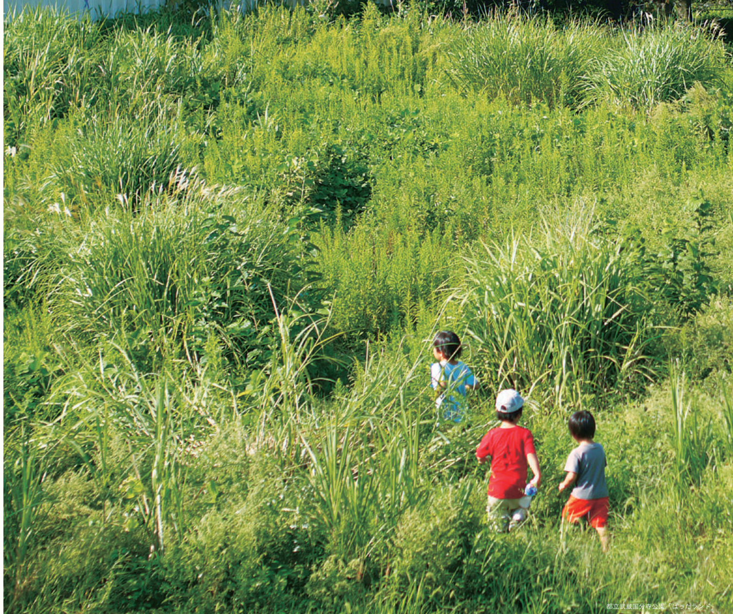
都立武蔵国分寺公園「はったランド」

※「はったランド」では、草丈などを調整し、子どもたちが虫と触れ合える場になっています。