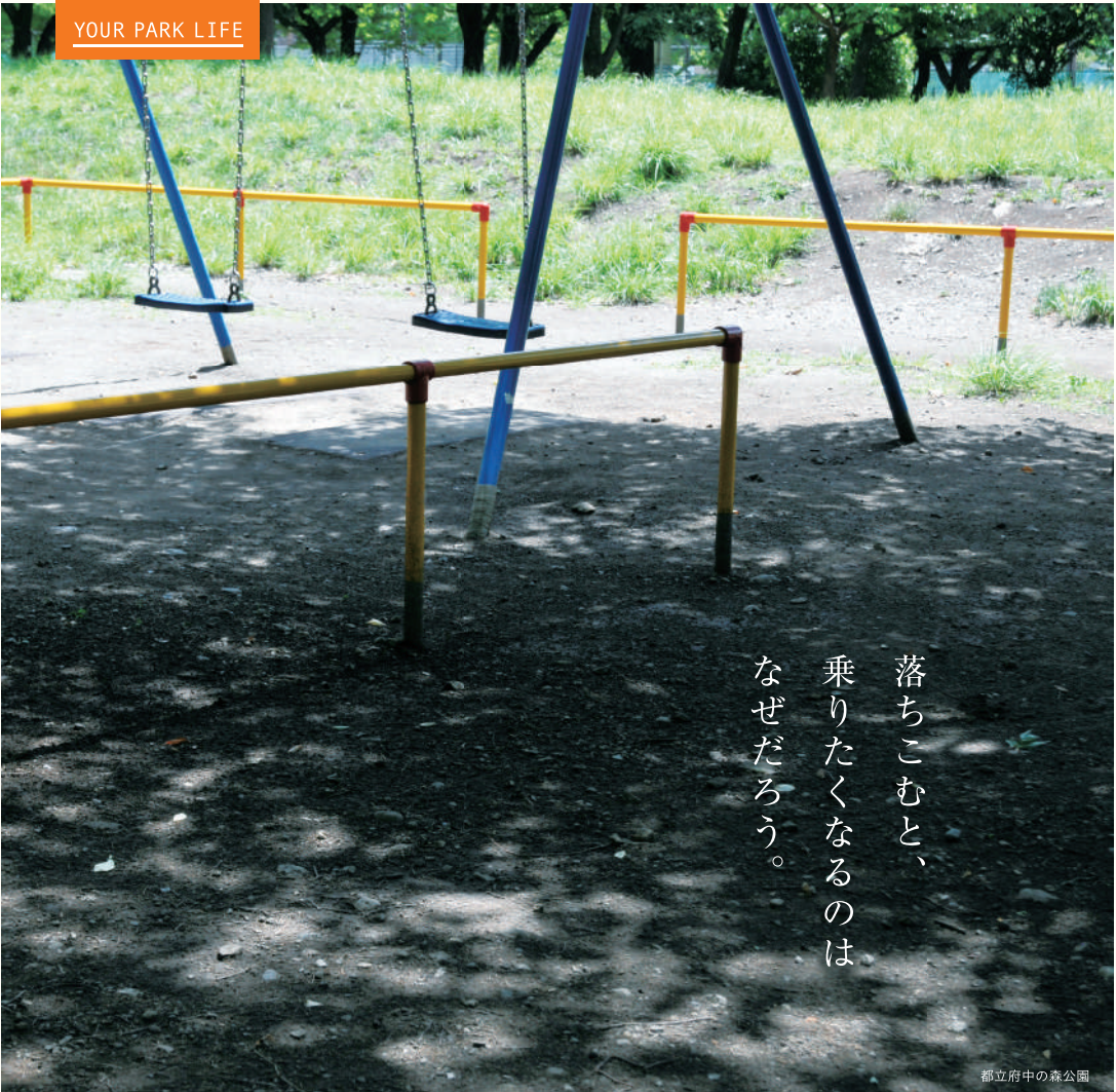
都立府中の森公園