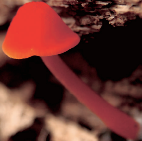
都立武蔵国分寺公園

しかけをめくると、きのこのおうちに暮らす、小さな生きものたちの生活をのぞくことができる絵本です。公園の中には、おとぎ話から飛び出してきたようなかわいいきのをたくさん見つけることができます。あなたのお気に入りのきのこのおうち、探してみませんか？