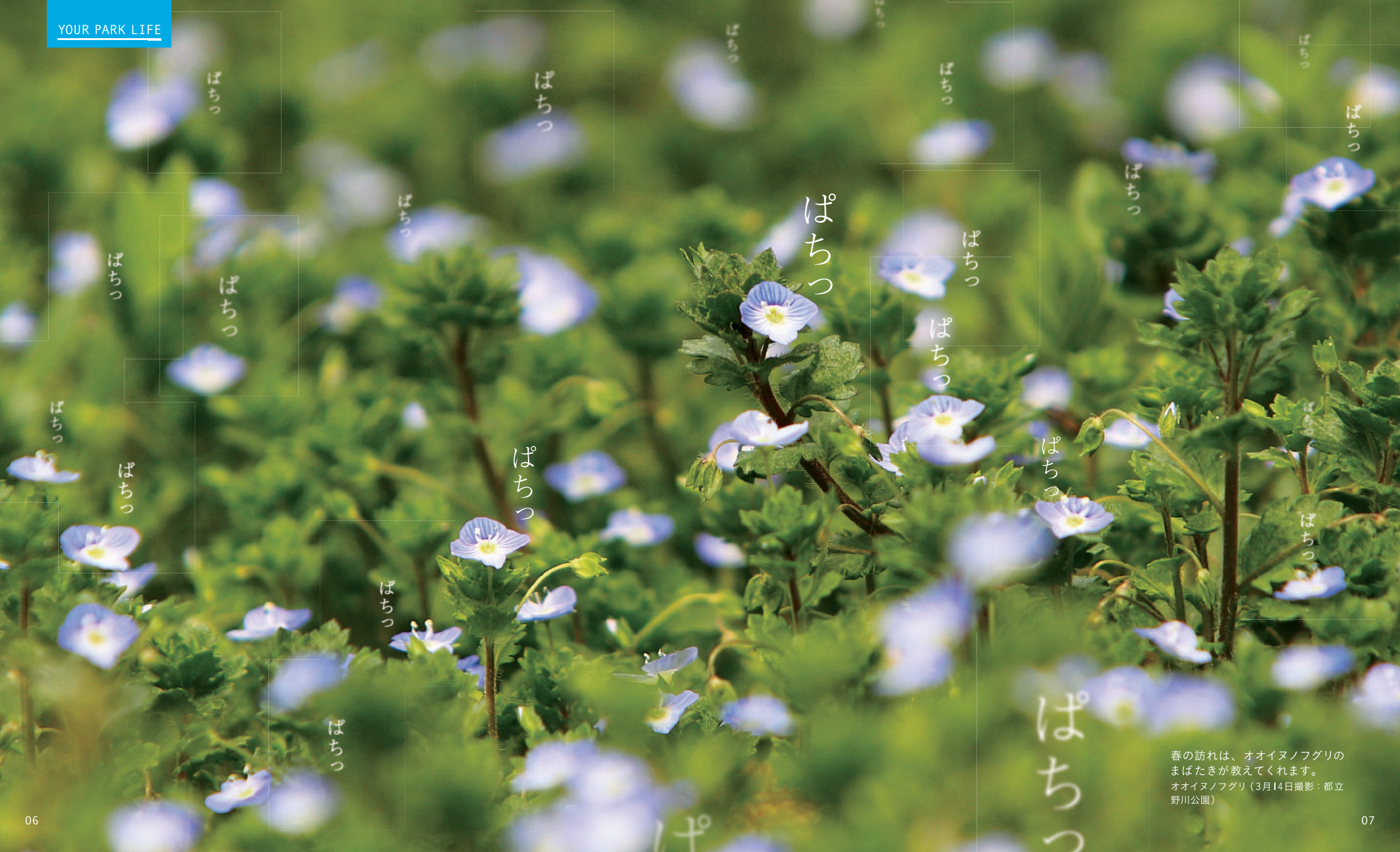
春の訪れは、オオイヌノフグリのまばたきが教えてくれます。 オオイヌノフグリ（3月14日撮影：都立野川公園）