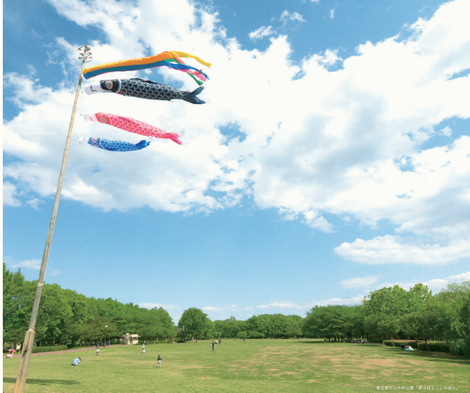
都立東村山中央公園「原っぱとこいのぼり」