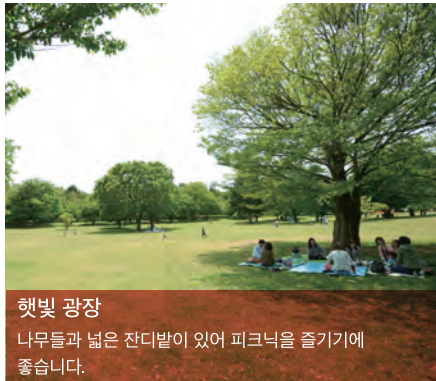
햇빛 광장 나무들과 넓은 잔디밭이 있어 피크닉을 즐기기에 좋습니다.