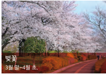
벚꽃 3월 말~4월 초.