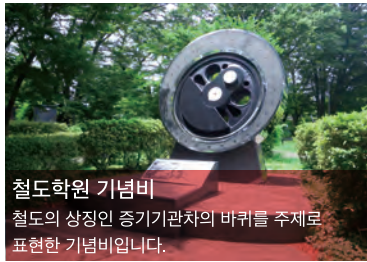
철도학원 기념비 철도의 상징인 증기기관차의 바퀴를 주제로 표현한 기념비입니다.