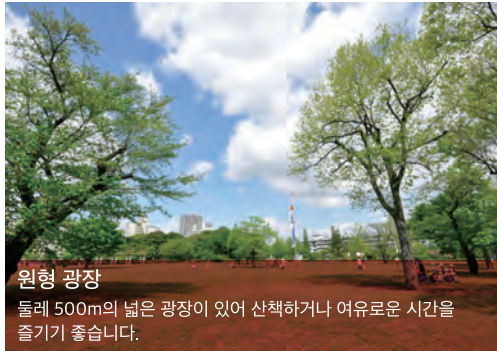
원형 광장 둘레 500m의 넓은 광장이 있어 산책하거나 여유로운 시간을 즐기기에 좋습니다.

<개원 일시> 2002년 4월 1일 <면적> 114,608.43㎡ (2019년 4월 현재)