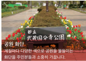
공원 화단 계절마다 다양한 색으로 공원을 물들이는 화단을 주민분들과 소중히 가꿉니다.