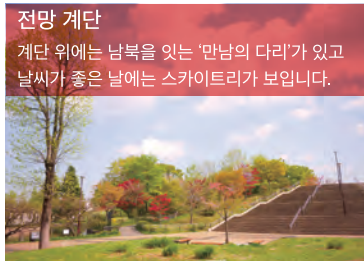
전망 계단 계단 위에는 남북을 잇는 '만남의 다리'가 있고 날씨가 좋은 날에는 스카이트리가 보입니다.