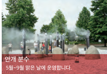
안개 분수 5월~9월 맑은 날에 운영합니다.