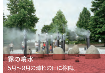
霧の噴水 5月～9月の晴れの日に稼働。