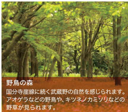
野鳥の森 国分寺崖線に続く武蔵野の自然を感じられます。アオゲラなどの野鳥や、キツネノカミソリなどの野草が見られます。