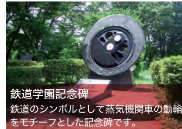
鉄道学園記念碑 鉄道のシンボルとして蒸気機関車の動輪をモチーフとした記念碑です。