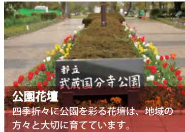
公園花壇 四季折々に公園を彩る花壇は、地域の方々と大切に育てています。