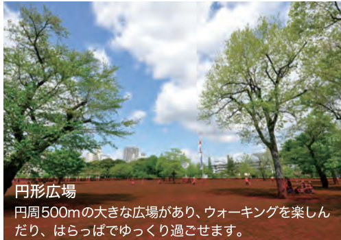
円形広場 円周500mの大きな広場があり、ウォーキングを楽しんだり、はらっぱでゆっくり過ごせます。