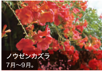
ノウゼンカズラ 7月～9月。