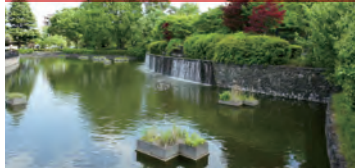
武蔵の池 扇の滝が流れ、水辺にはカワセミやカルガモが飛来します。