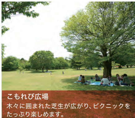
こもれび広場 木々に囲まれた芝生が広がり、ピクニックをたっぷり楽しめます。