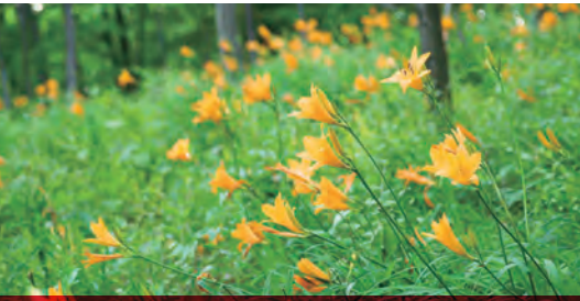
ムサシノキスゲ 浅间山公園だけに自生するユリ科の植物。5月中旬に見ごろを迎え、浅间山を彩ります。

※ 障害者用の駐車場をご利用の際は、必ず事前に武蔵野公園サービスセンターにご連絡ください。