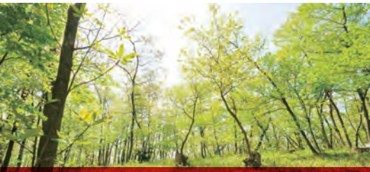
新緑の雑木林 武蔵野の面影を残すコナラ、シデなどの雑木林。貴重な自然景観として保護されています。