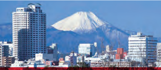
富士見百景 (冬富士) 写真提供：浅间山自然保護会